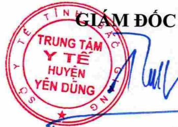
Đặng Hữu Tuấn